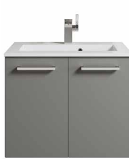
Türen Typ D Knauf / Griff siehe Kapitel 14