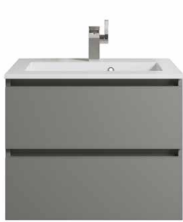
Typ C Grifflos, Kehrleiste in Korpusfarbe