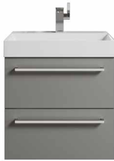
Typ D Knauf / Griff siehe Kapitel 14